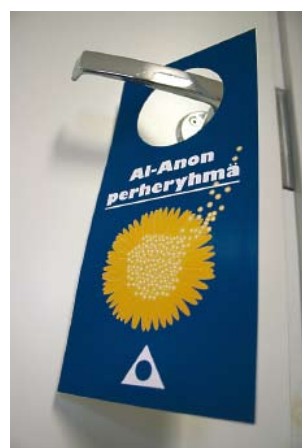
AL-ANON RYHMÄ auttaa alkoholistien läheisiä.